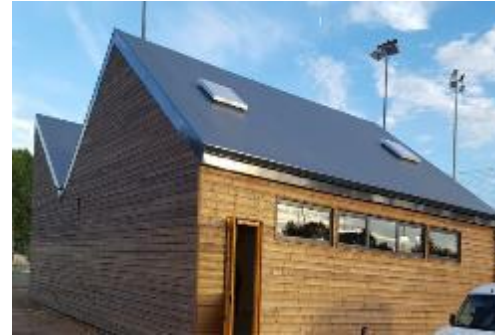
Dojo Jean-Luc Rougé Rue André Chesnier