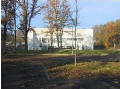
Dojo du Luat Route de Montlignon