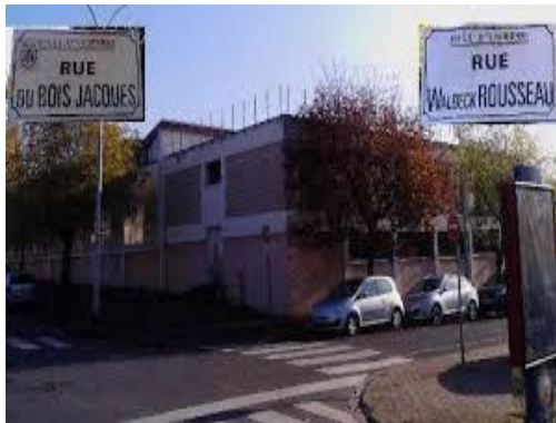
Gymnase du Bois Jacques Rue du Bois Jacques