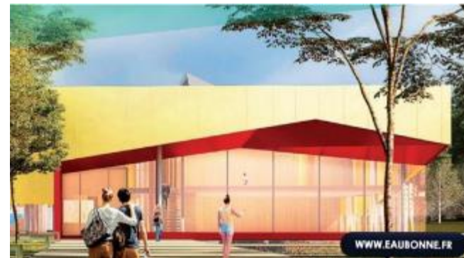
Nouveau Complexe Sportif Georges Hebert Livvable Avril 2022